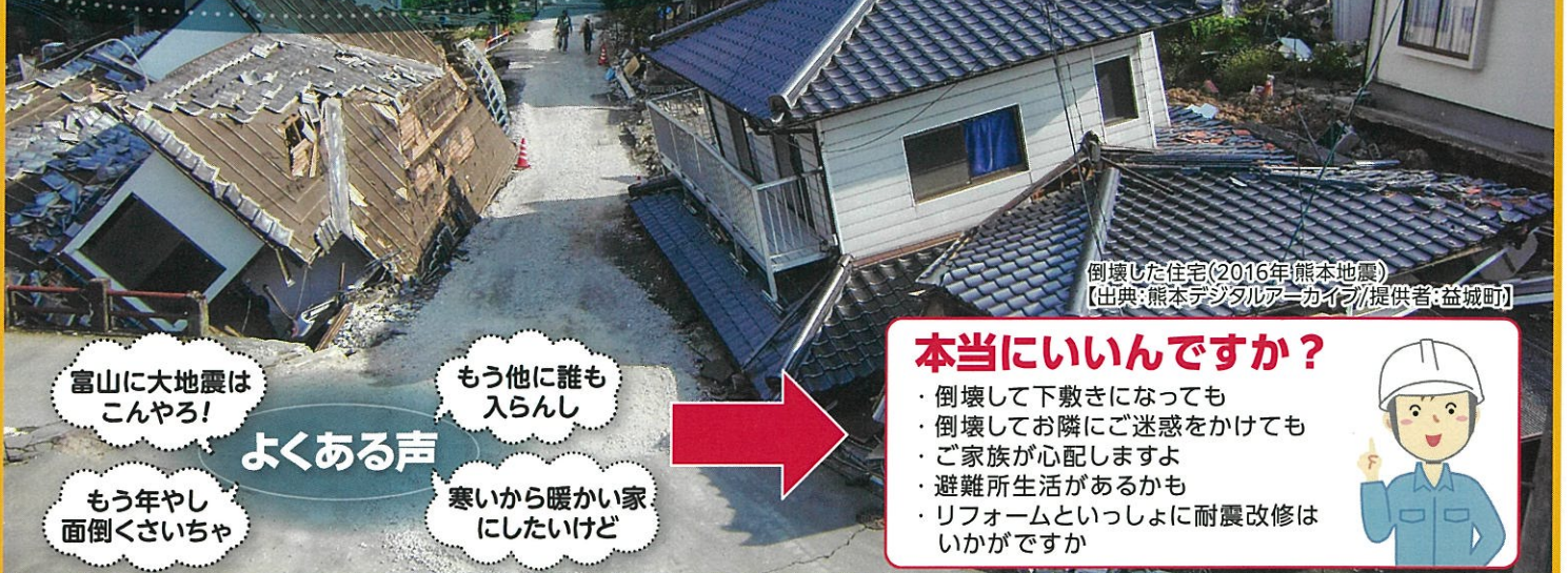
倒壊した住宅(2016年熊本地震)